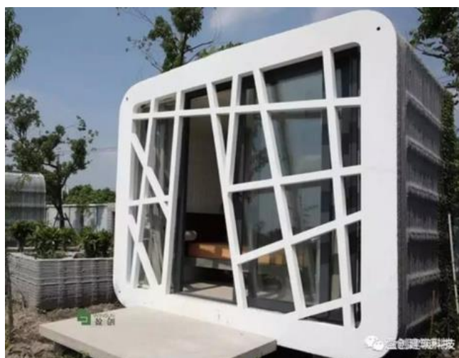
Maison de Quarantaine réalisée en 2 jours en Chine

En matière de disruption, nous avons pu remarquer les percées permises par les imprimantes 3D, que ce soit pour réaliser de simple masques-visières, ou des « maisons de confinement en quarantaine ». D'autres imprimantes 3D pour la construction sont également en développement en France, à la « Serre Numérique » de Valenciennes (à suivre..)